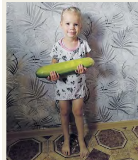
«Огурец — молодец»

Друзья! Наверняка у вас уже есть, чем поделиться с нами: может, собрали шикарный урожай овощей и ягод или вырастили самый большой или необычный овощ или фрукт. Давайте порадуемся и удивимся такому урожаю вместе! Фотографии урожая овощей, фруктов и ягод, выращенных на собственном приусадебном участке и оригинальные названия к ним присылайте на электронную почту редакции: vorobevka@riavrn.ru, в личные сообщения в соцсети или приносите по адресу: с. Воробьевка, ул. 1Мая, 152/1.