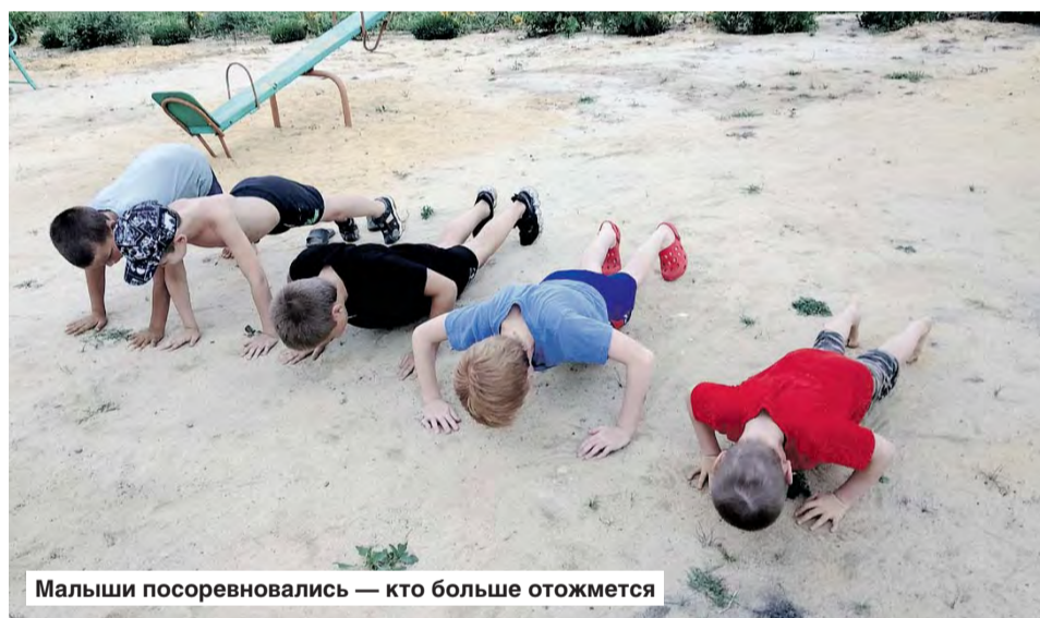
Малыши посоревновались — кто больше отожмется