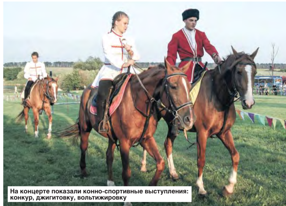
На концерте показали конно-спортивные выступления: конкур, джигитовку, вольтижировку

Сумма, собранная на еженедельных концертных мероприятиях, составила около 300 тысяч рублей