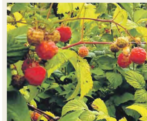
Ягода малина