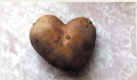
«Картофельное сердечко»