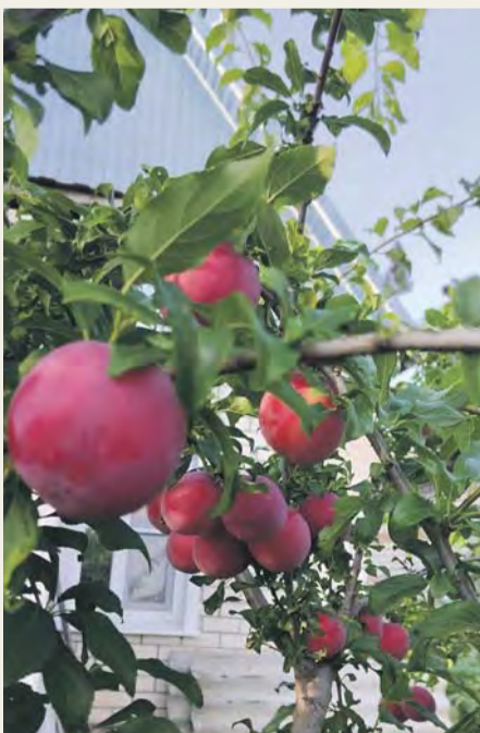
Алыча «Сияние ракеты»