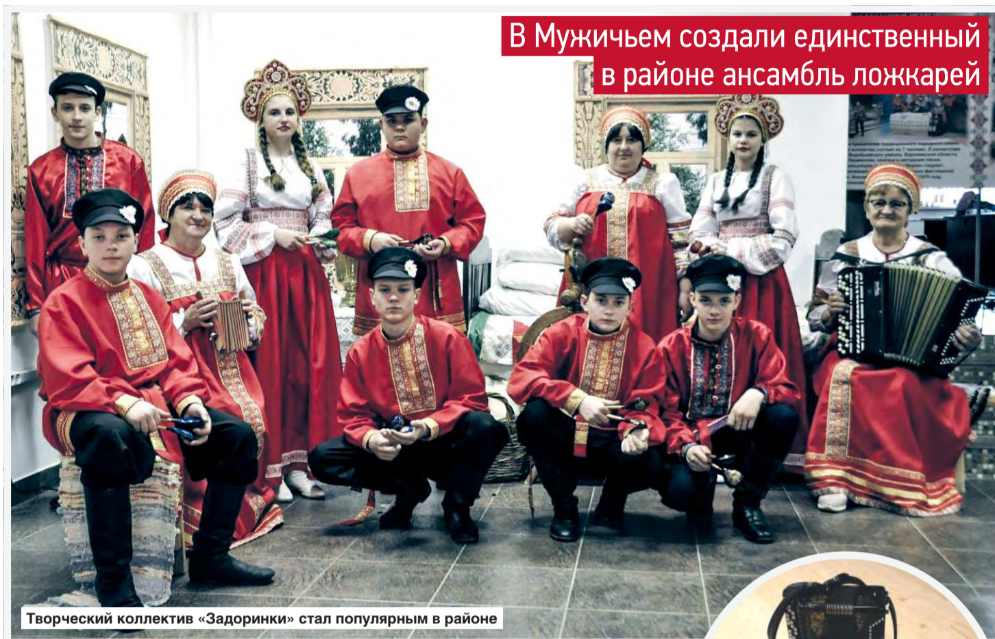
Творческий коллектив «Задоринки» стал популярным в районе

В Мужичьем создали единственный в районе ансамбль ложкарей