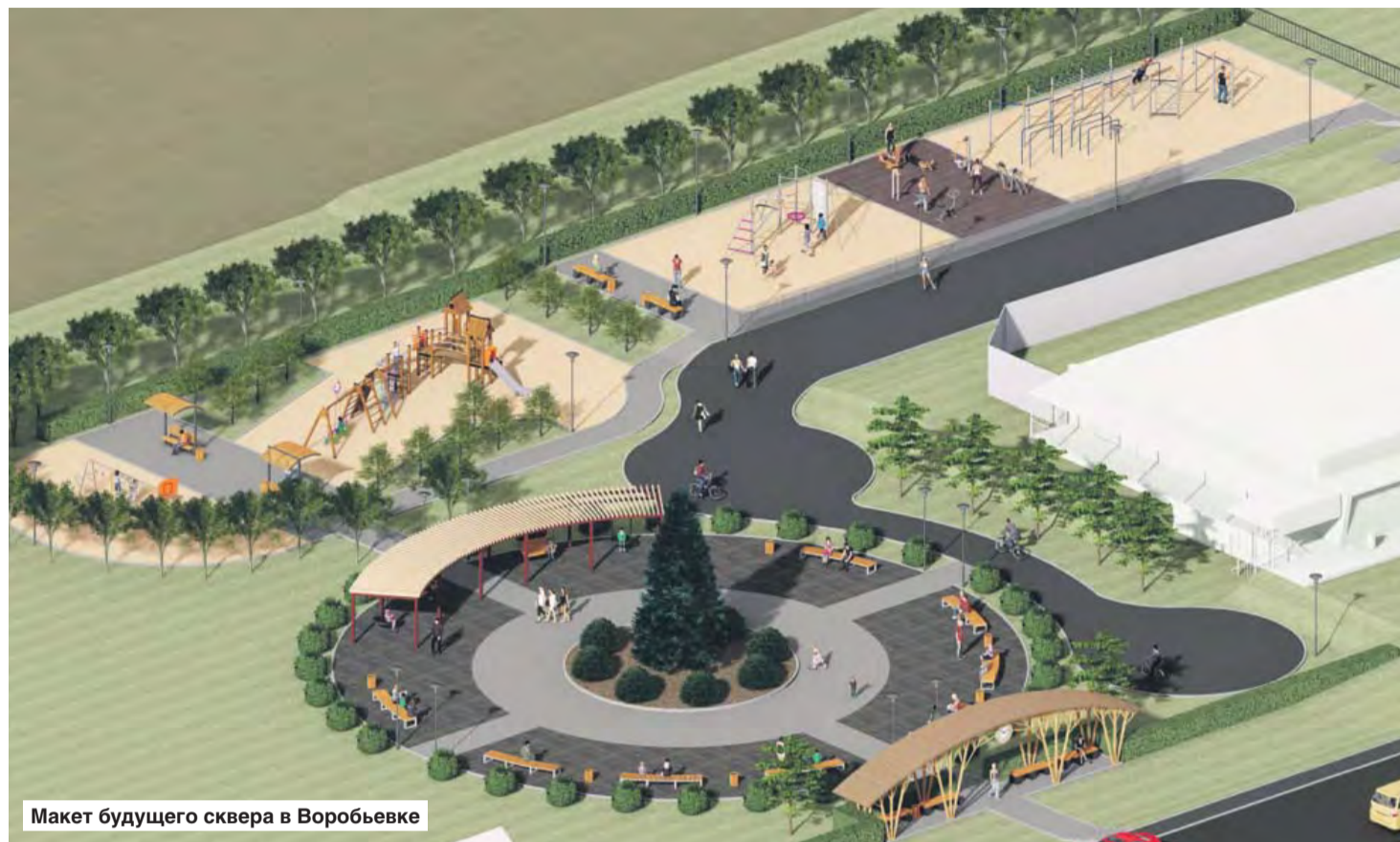
Макет будущего сквера в Воробьевке