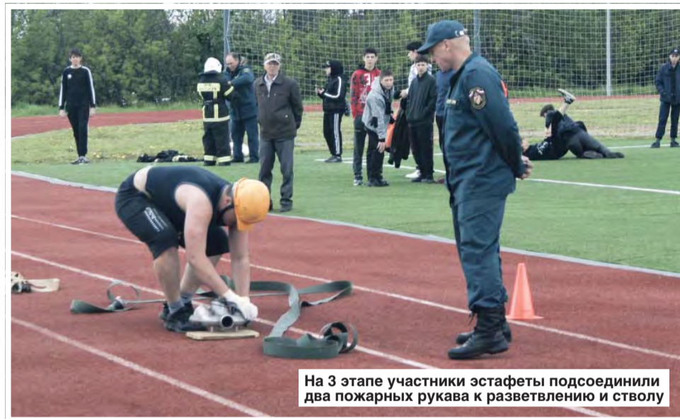
На 3 этапе участники эстафеты подсоединили два пожарных рукава к разветвлению и стволу

— Подобные соревнования очень интересны и важны, я участвовал первый раз, но обязательно в следующем году приму