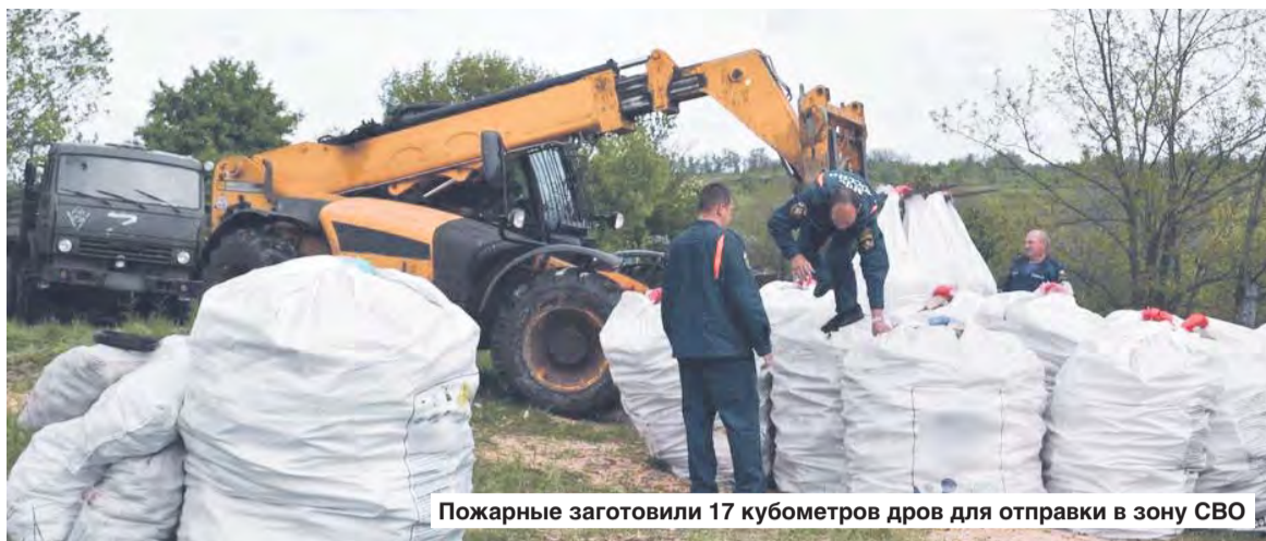
Пожарные заготовили 17 кубометров дров для отправки в зону СВО