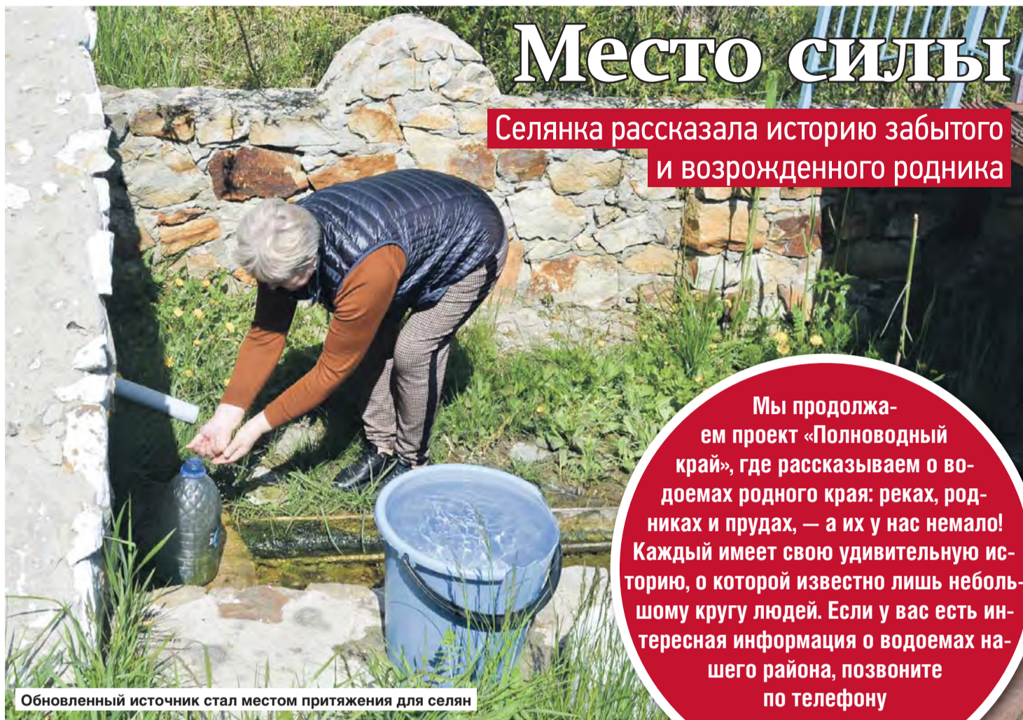
Обновленный источник стал местом притяжения для селян