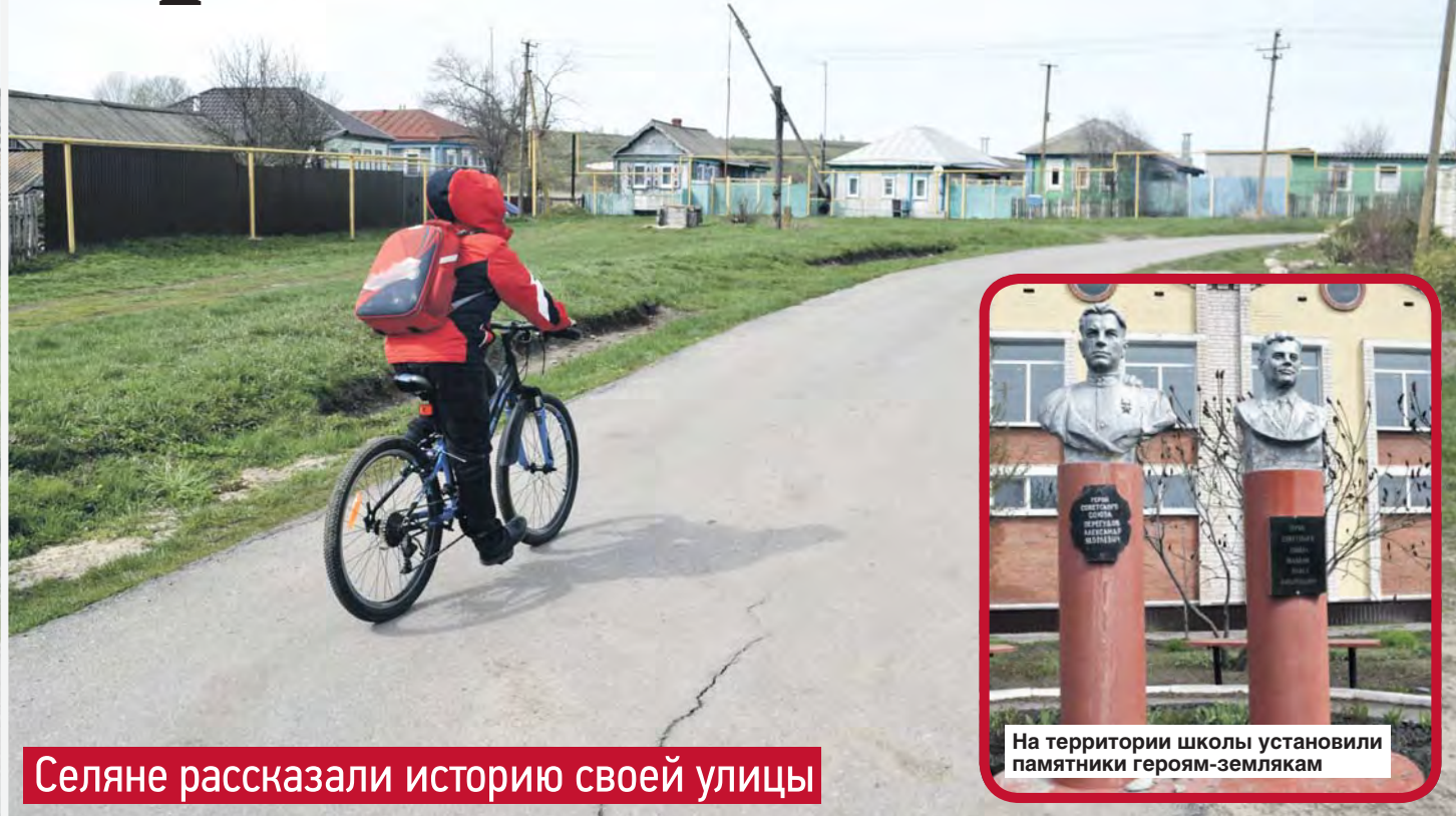
Селяне рассказали историю своей улицы