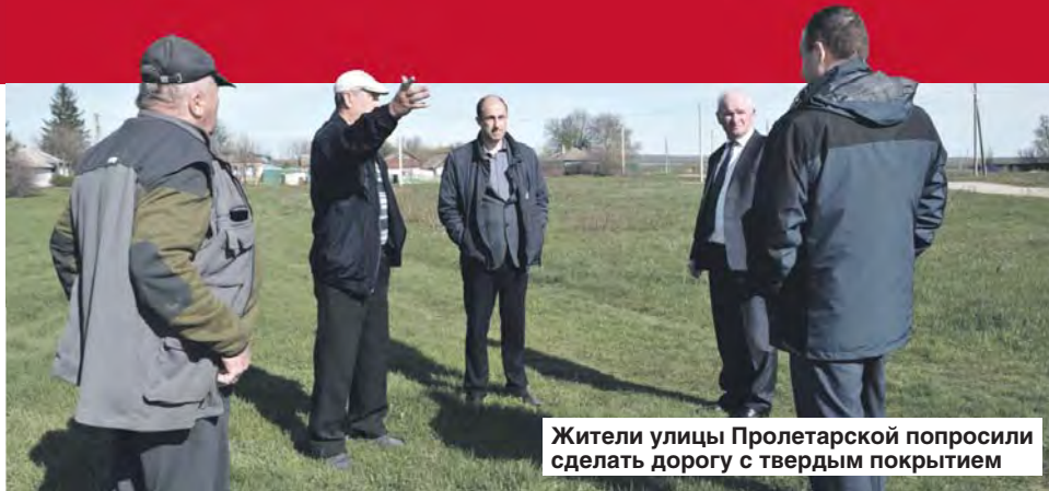
Жители улицы Пролетарской попросили сделать дорогу с твердым покрытием

Житель Новотолучеево пожаловался на то, что в летний сезон невозможно проехать через поля за ягодами и на водоем искупаться, все полевые дороги распаханы.