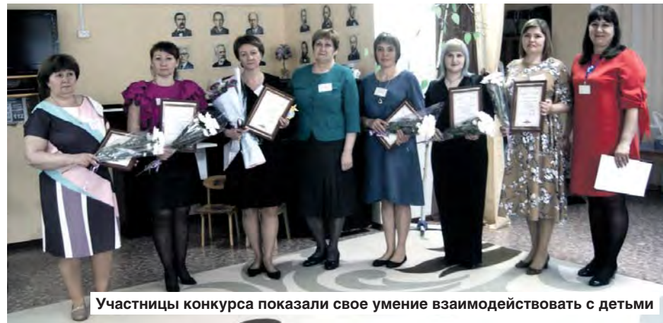
Участницы конкурса показали свое умение взаимодействовать с детьми

В районе прошел муниципальный этап конкурса «Воспитатель года-2023»