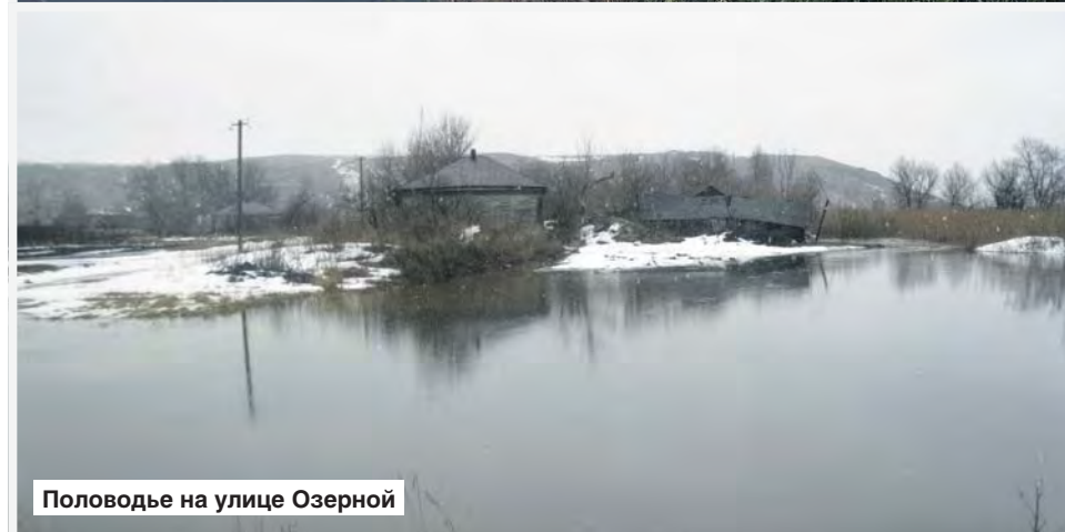
Половодье на улице Озерной

В мареве пыльцы волнуются моря пшеницы и ячменя, глухо, как сосны, шумят зеленые рощи кукурузы, и переливчато играет на солнце изумрудная рябь луговых трав. А вверху несмолкаемый щебет бесчисленных птиц. В долине, у подножия холмов, между