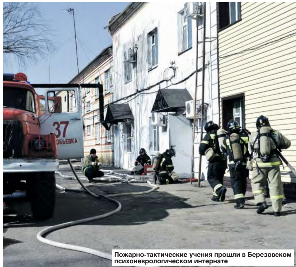
Пожарно-тактические учения прошли в Березовском психоневрологическом интернате

По прибытию пожарных подразделений руководитель объекта доложил начальнику