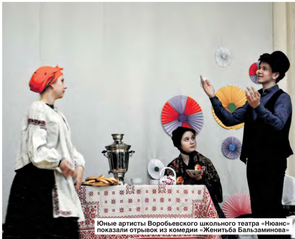
Юные артисты Воробьевского школьного театра «Нюанс» показали отрывок из комедии «Женитьба Бальзаминова»