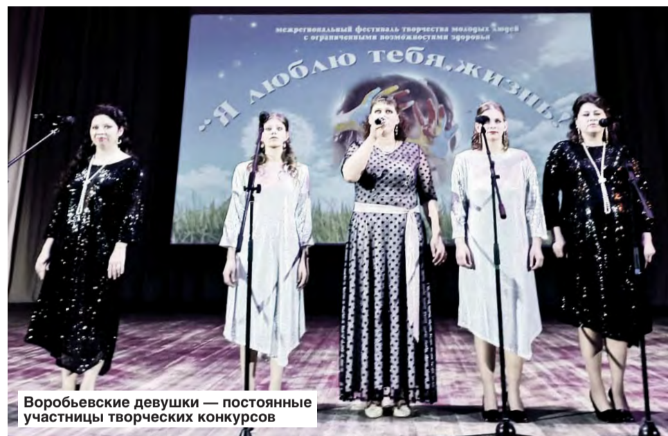
Воробьевские девушки — постоянные участницы творческих конкурсов