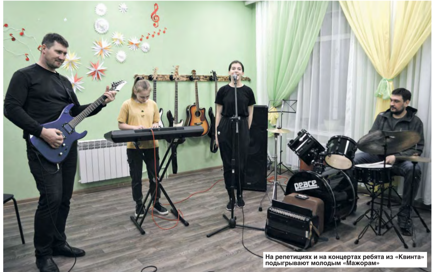
На репетициях и на концертах ребята из «Квинта» подыгрывают молодым «Мажорам»

Березовские «Квинты» воспитывают молодых «Мажоров»