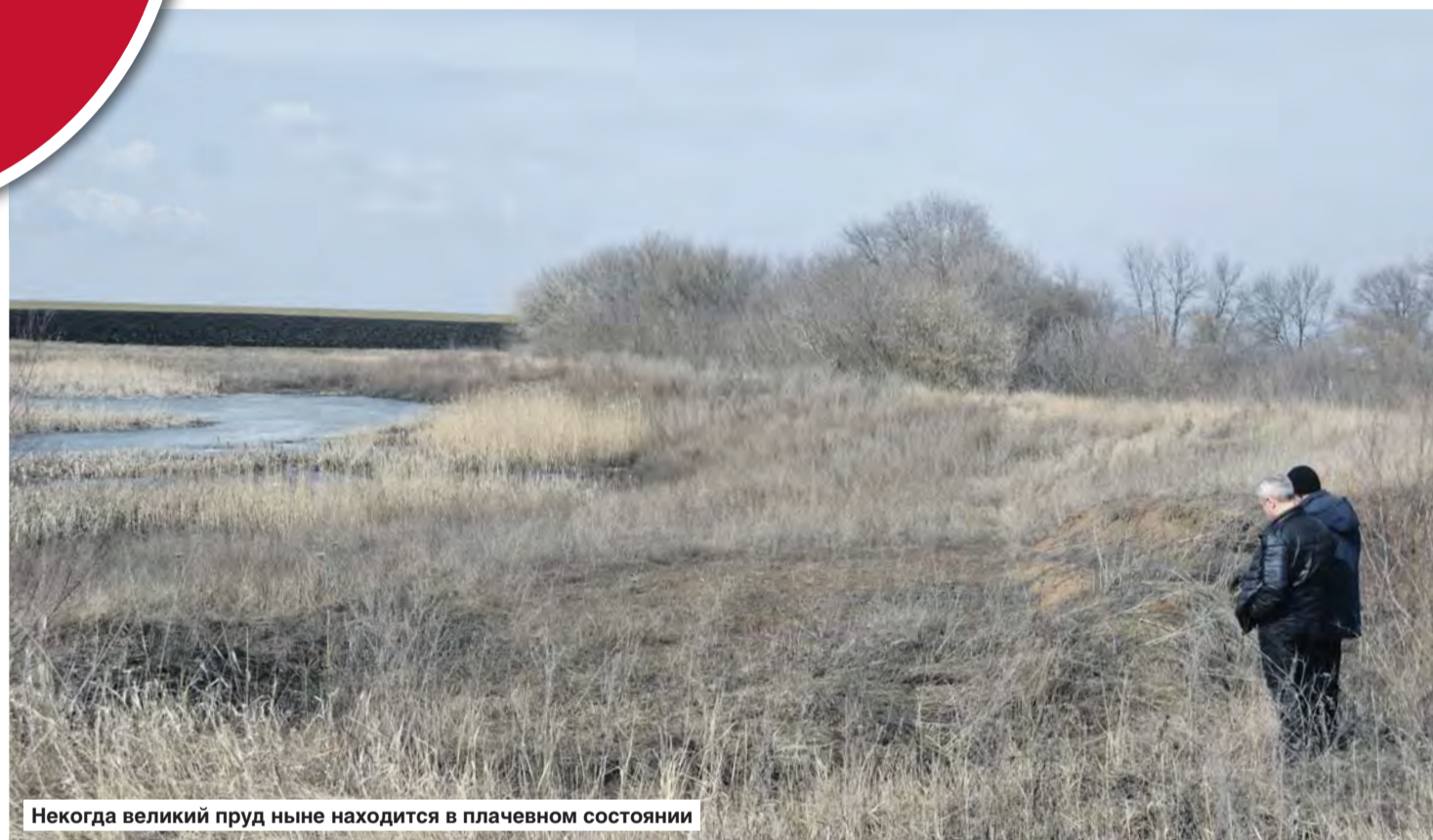
Некогда великий пруд ныне находится в плачевном состоянии