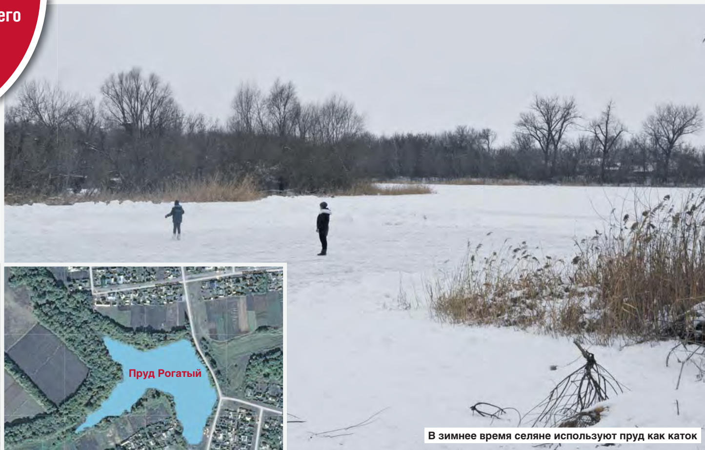
В зимнее время селяне используют пруд как каток

Житель совхоза «Воробьевский» рассказал о сельском водоеме