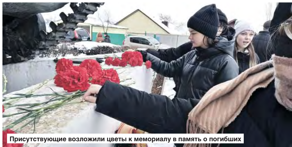
Присутствующие возложили цветы к мемориалу в память о погибших