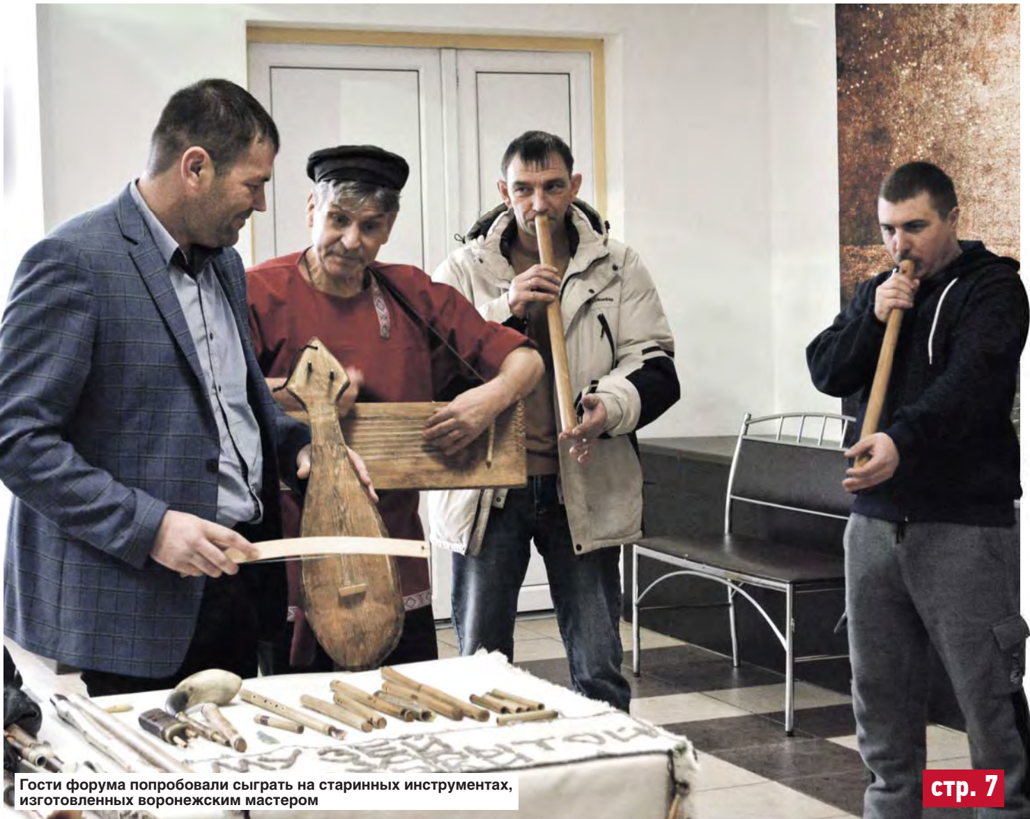
Гости форума попробовали сыграть на старинных инструментах, изготовленных воронежским мастером

В районе впервые прошел культурный форум