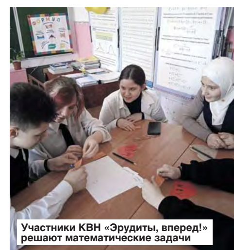
Участники КВН «Эрудиты, вперед!» решают математические задачи