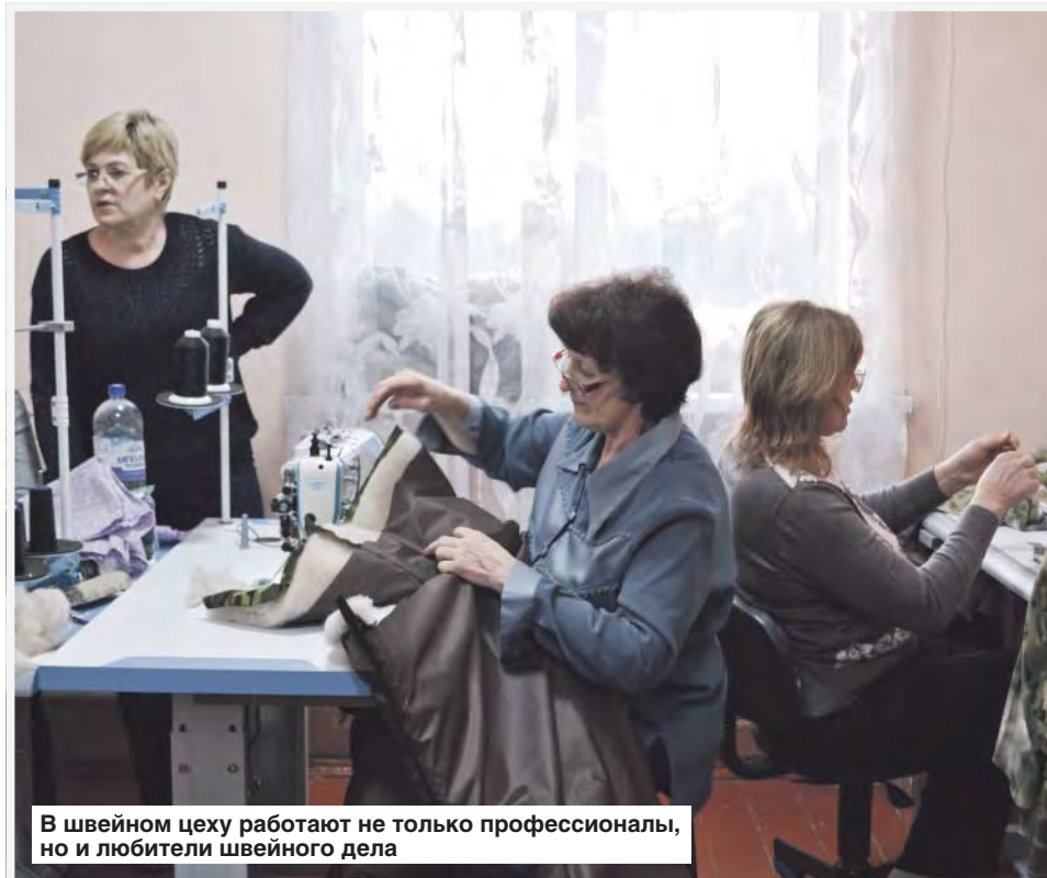
В швейном цеху работают не только профессионалы, но и любители швейного дела

— Оборудование, на котором мы работаем, отличное, машинки професси-