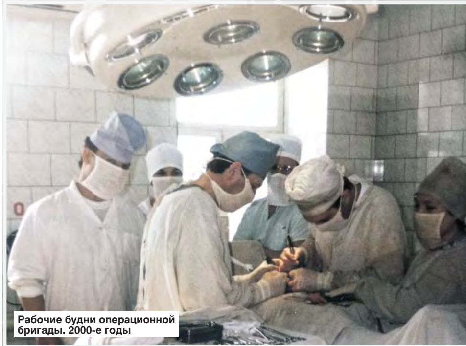
Рабочие будни операционной бригады. 2000-е годы

инструментов, предугадывая все манипуляции врача. Во время операции между медсестрой и оперирующим хирургом ведется постоянный монолог глазами, понятный лишь посвященным. Врач во время операции протягивает руку, а медсестра уже знает, что ему нужно подать.