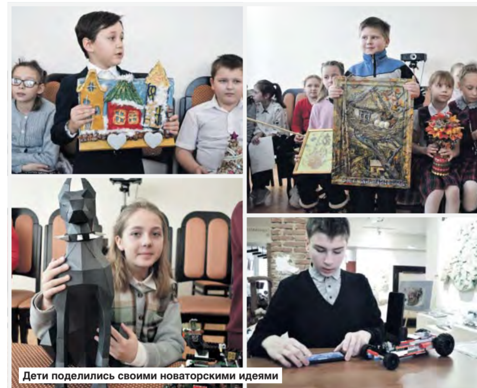
Дети поделились своими новаторскими идеями