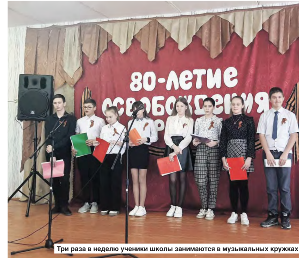
Три раза в неделю ученики школы занимаются в музыкальных кружках

музыки в школе свидетельствует о том, что человек может измениться к лучшему, если в школе музыка не только как забава, развлечение, а прежде всего как духовная пища, бальзам. За это время у нее обучалось более тысячи учеников. Конечно, большинство из них не стали профессиональными музыкантами. Но для многих