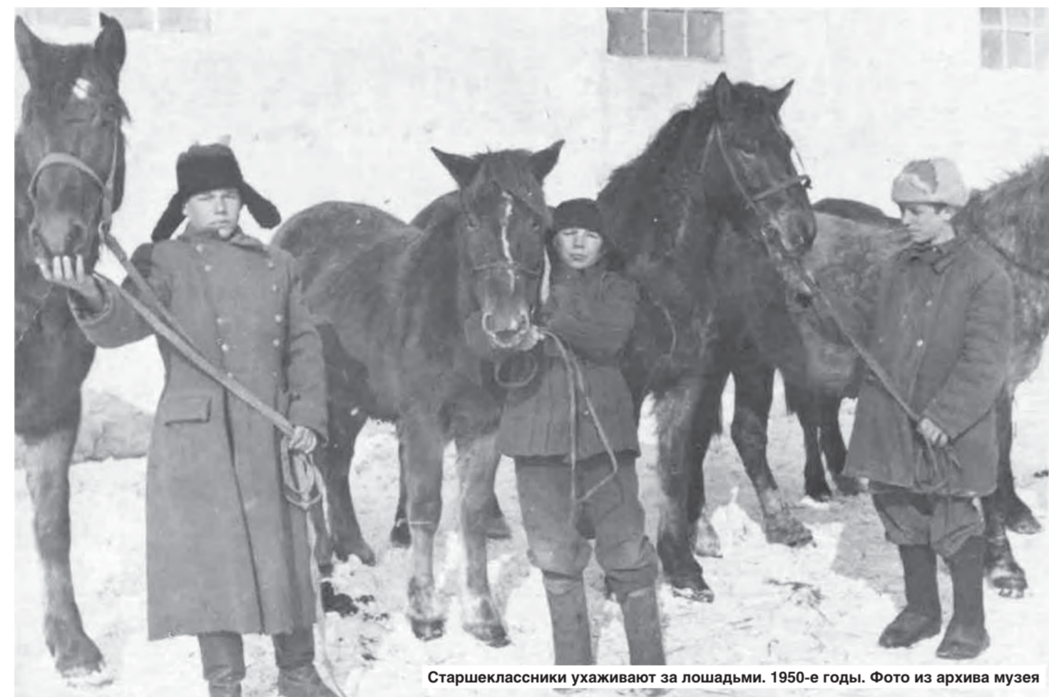
Старшеклассники ухаживают за лошадьми. 1950-е годы.

В школах района в прошлом веке организовывали звенья по уходу за кроликами, телятами и лошадьми