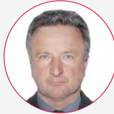
Глава поселения Юрий Савченко: