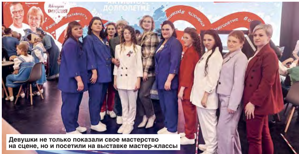
Девушки не только показали свое мастерство на сцене, но и посетили на выставке мастер-классы

граммы представила девочек как лауреатов и призеров международных и российских конкурсов, особо отметив крылатое название коллектива — «Птица счастья». Они вышли уве-