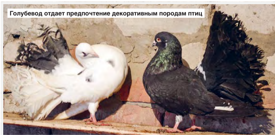
Голубевод отдает предпочтение декоративным породам птиц