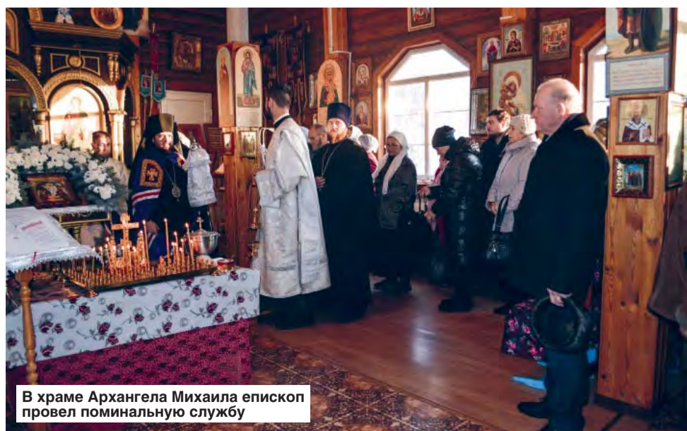
В храме Архангела Михаила епископ провел поминальную службу