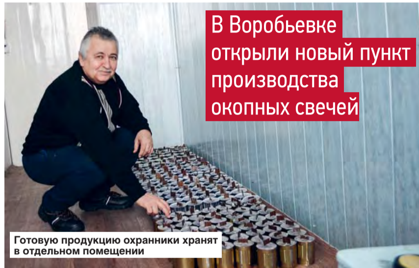
Готовую продукцию охранники хранят в отдельном помещении

В Воробьевке открыли новый пункт производства окопных свечей