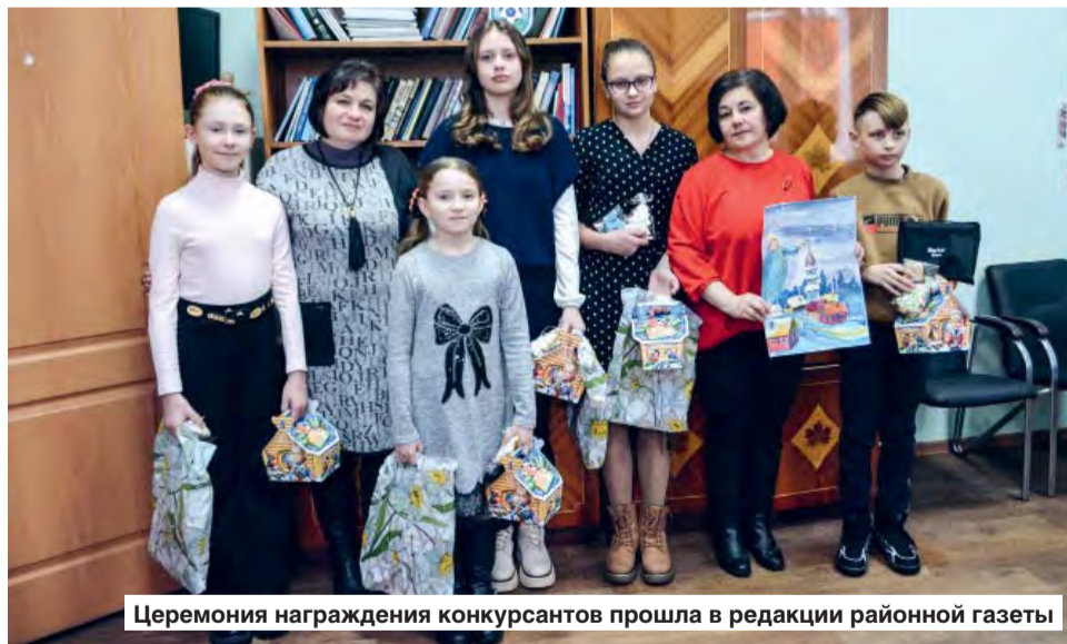
Церемония награждения конкурсантов прошла в редакции районной газеты

Все школьники, приглашенные на награждение, впервые приняли участие в