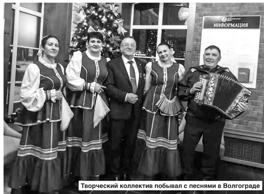
Творческий коллектив побывал с песнями в Волгограде

В понедельник, 15 января, народный фольклорный казачий ансамбль «Конязек» принял участие в международной научно-практической конференции «Развитие аграрно-пищевых технологий», которая прошла в городе Волгограде.